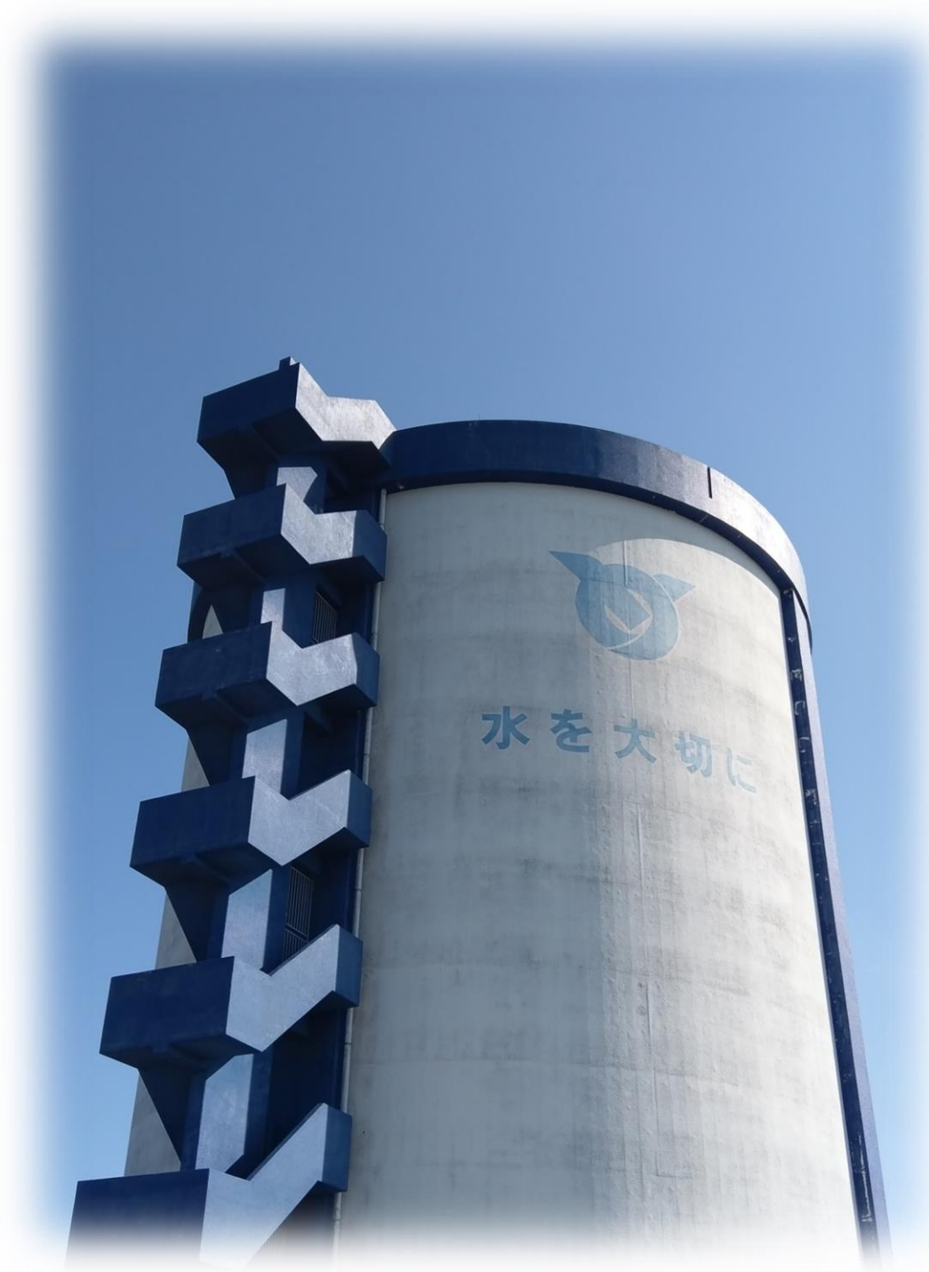
嘉手納町久得配水池