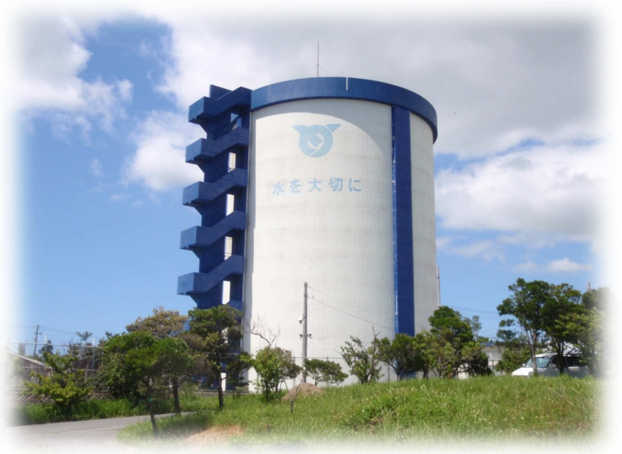
嘉手納町久得配水池