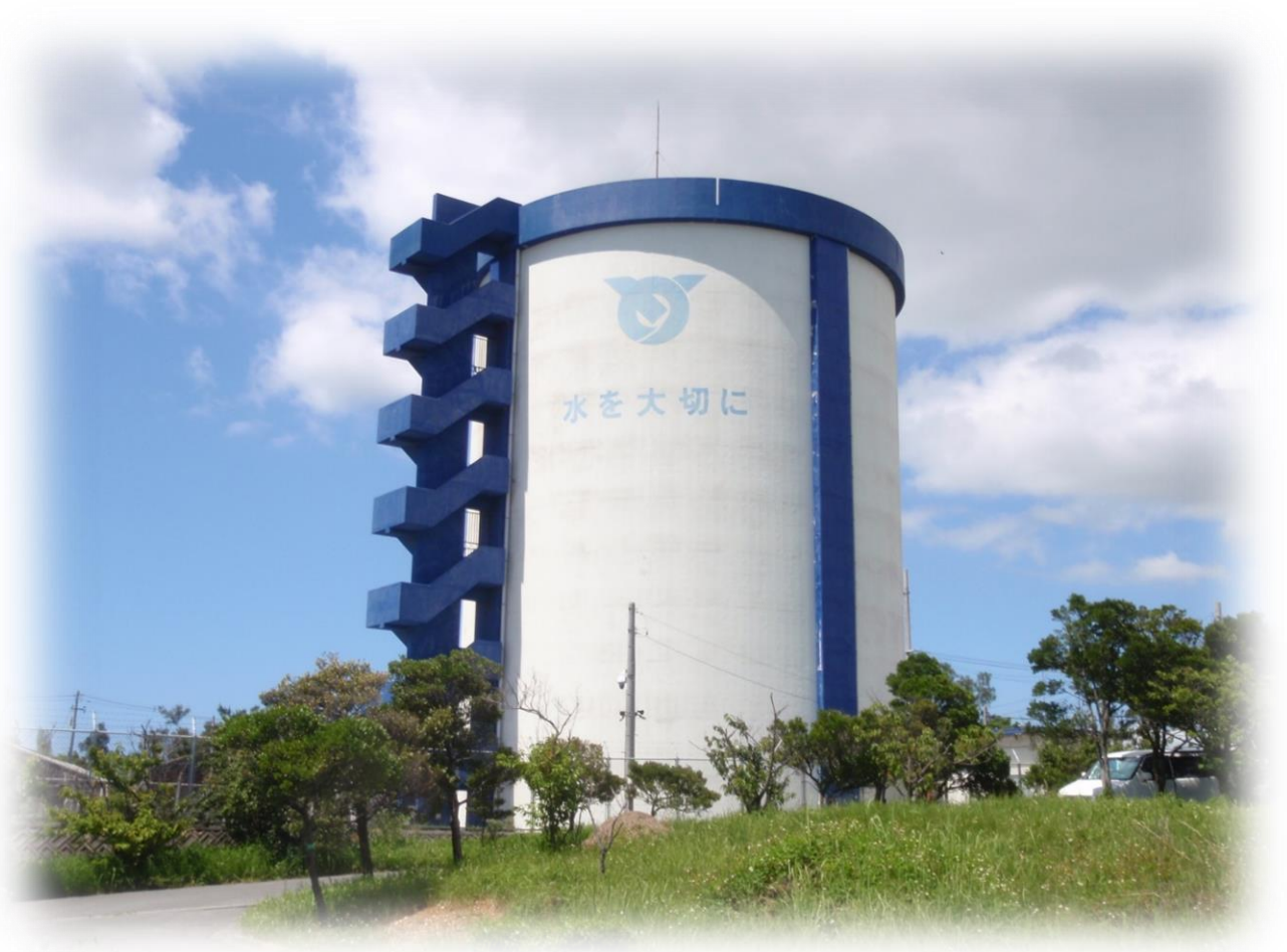
嘉手納町久得配水池