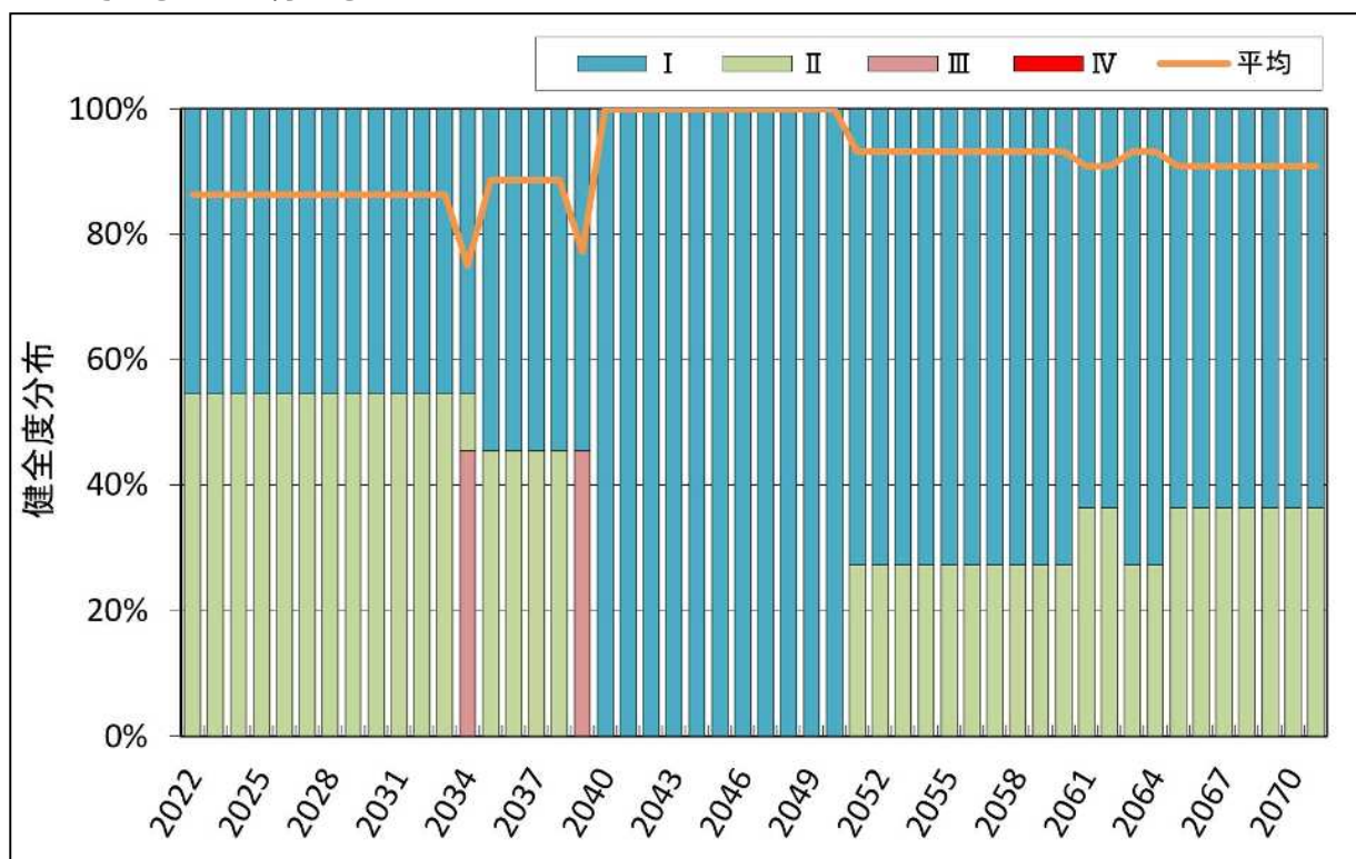
図7-2 健全度分布の推移

健全度の平均値の推移を見ると常に健全度の平均が80%以上の値を示しており、健全度が保たれていることが分かる。