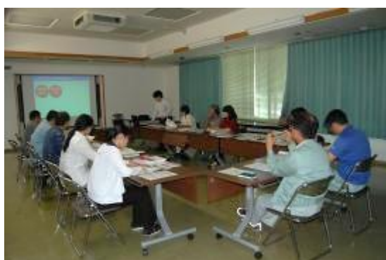
(庁内策定委員会の様子)