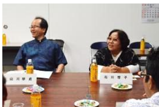
(3) 庁内検討委員会の内容