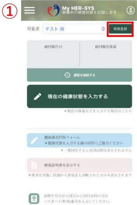
① 「新規登録」 ボタンを押す