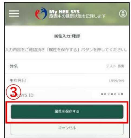
③ 内容を確認し、「属性を保存する」を押して完了です