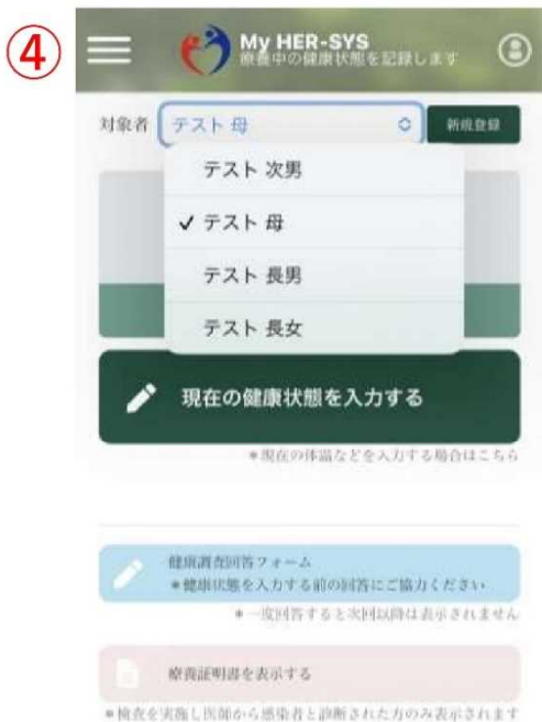
④ 対象者をドロップダウンリストで選択できるようになる