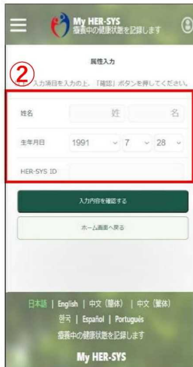
② ご家族の属性 (姓名、生年月日、HER-SYS ID) を入力する