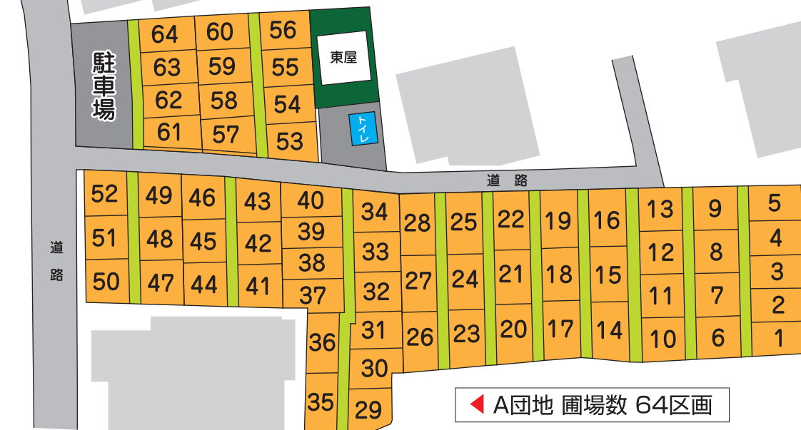
◀ A団地 圃場数 64区画