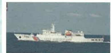
砲のようなものを搭載した 領海侵入を繰り返す中国の 海警船舶