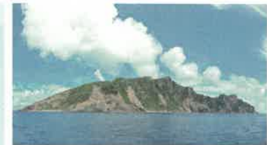
尖閣諸島（沖縄県石垣市）