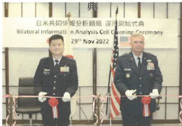
日米共同情報分析組織 運用開始式典