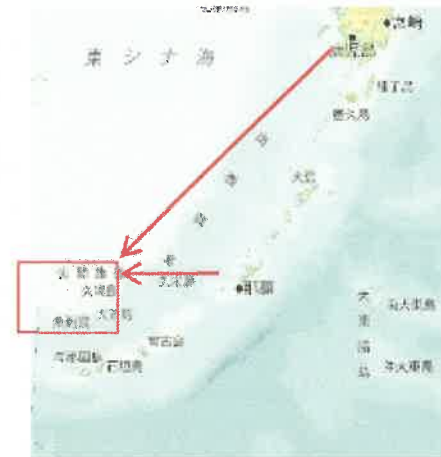
尖閣諸島までの距離 (イメージ)